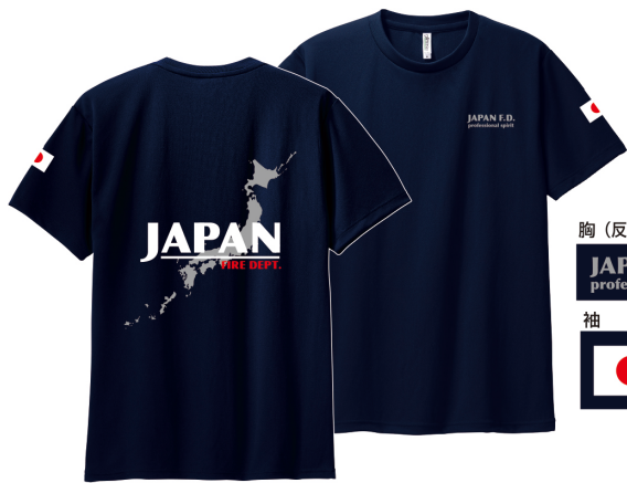
背中 (一部反射インク使用)

Tシャツ・トレーナー等がオリジナルで作れます。お問い合わせ下さい。(記念品袋付)