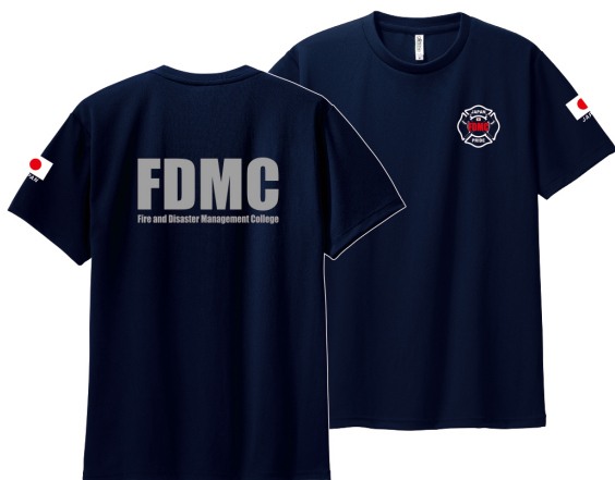
背中 (反射インク使用)